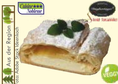
Aus der Region