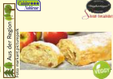
Aus der Region