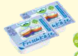
Aus der Region