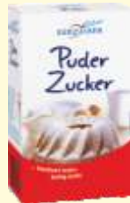
Aus der Region