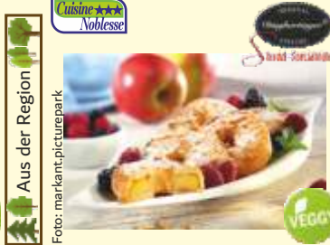
Aus der Region